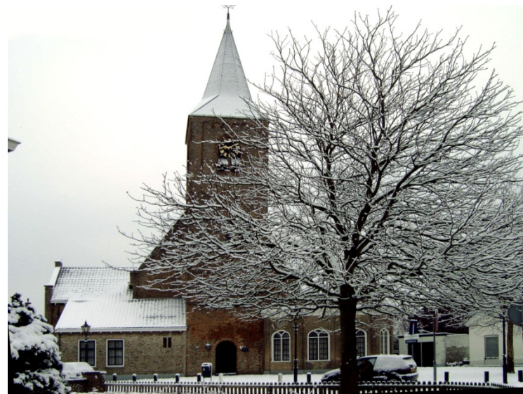
Het Kerkplein in wintersfeer

Ook dit jaar nemen wij op zaterdag december weer deel aan de Winterfair op en rond het Kerkplein. Wij zijn daar met twee kramen aanwezig en ook Den Brommert is op die dag geopend. Het is mogelijk dat daar grote of kwetsbare voorwerpen, die na de verbouwing overtollig zijn geworden of niet rechtstreeks met H.I.Ambacht te maken hebben, te koop worden aangeboden.